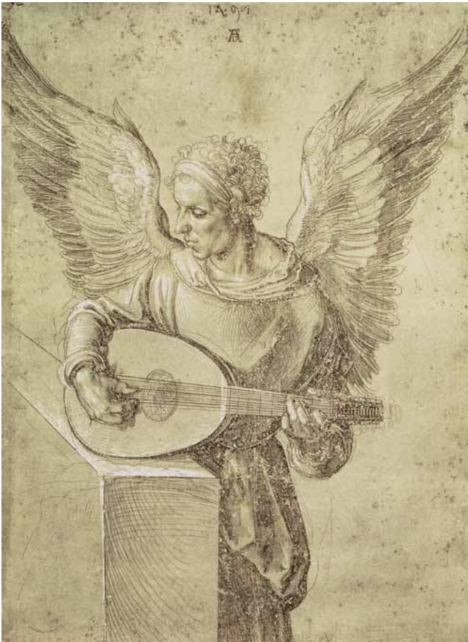
Albrecht Dürer, Ange jouant au luth , 1491

Figure de l'interstice, éthérée, asexuée, extraterrestre biblique, incarnation de la beauté - la représentation de l'ange est aussi délicate que son origine et sa fonction sont mystérieuses.