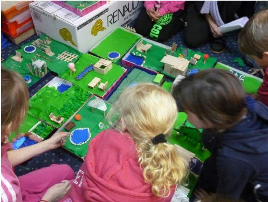
Atelier enfants à l'International School of Paris, 2014

L'artiste propose aux enfants (et aux parents qui le souhaitent) de vivre une expérience artistique, ludique et inventive durant laquelle ils pourront laisser libre cours à leur imagination, en créant leur jardin miniature à la manière de ceux, magiques, venus de l'extrême Orient.