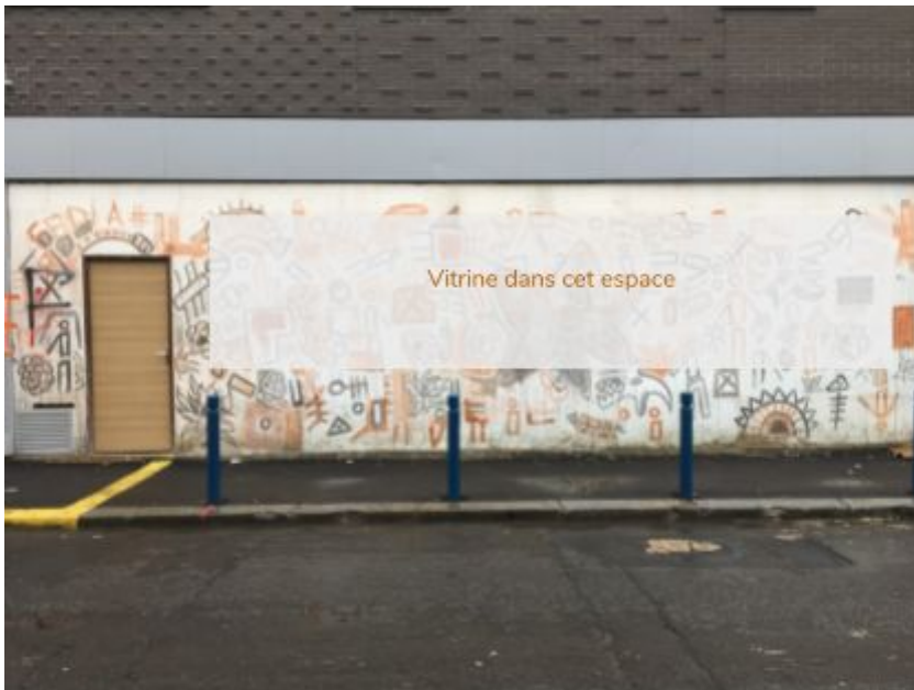
4, rue Lecuyer 93300 Aubervilliers Vitrine d'exposition d'objets d'arts